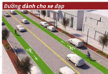
Đường dành cho xe đạp

Dưới đây là một số ví dụ về việc cải thiện khả năng tiếp cận di chuyển: