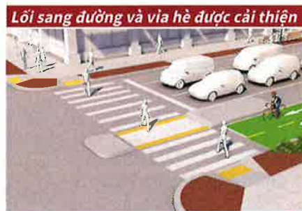
Lối sang đường và vỉa hè được cải thiện